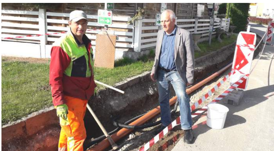
Strassenbauprogramm - Gehsteigsanierung

Zügig voran schreitet die Sanierung der Kanalstränge im Bereich Markt Leopoldschlag. Durch die zum Großteil durchgeführten grabungslosen Sanierungsmaßnahmen konnten die Behinderungen in Grenzen gehalten werden. Es ist geplant, dass die Arbeiten noch heuer abgeschlossen werden können.